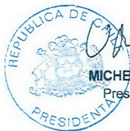
MICHELLE BACHELET JERIA Presidenta de la República