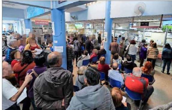
ESCASEZ DE PERSONAL. — La alta demanda en el retiro de medicamentos y la baja cantidad de personal que tienen las farmacias de los recintos públicos hacen que las salas de espera suelen estar aglomeradas.